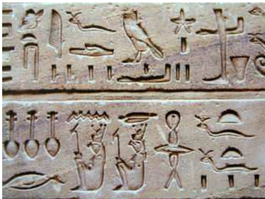
Ιερογλυφικό κείμενο της εποχής των Πτολεμαίων

Τα ιερογλυφικά είναι τα αρχαιότερα εικονιστικά σύμβολα που χρησιμοποιούνταν στην αρχαία αιγυπτιακή γραφή. Η λέξη προέρχεται από τα αρχαία ελληνικά: «αερέσ γλυφές» (δηλαδή ιερά ανάγλυφα), επειδή χρησιμοποιήθηκαν σε ιερά θρησκευτικά κείμενα. Η γραφή αυτή αποκρυπτογραφήθηκε από τον Ζαν-Φρανσουά Σαμπολιόν το 1822, ο οποίος χρησιμοποίησε την περίφημη Στήλη της Ροζέτας.